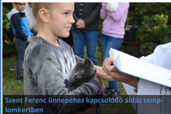
Szent Ferenc ünnepéhez kapcsolódó áldás templomkertben