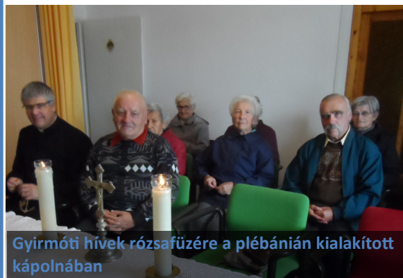
Gyirmóti hívek rózsafüzére a plébánián kialakított kápolnában