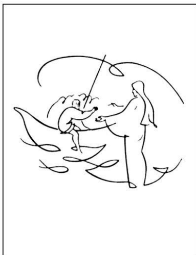
(II. János Pál 1993)

Szűz Mária, Izrael szűz leánya, támogasd anyai szeretetteddel azokat a fiatalokat, akiket az Atya megszólít, tartsd meg azokat, akik már megszentelt életet élnek. Ismételjék meg Veled együtt az örömteli és visszavonhatatlan önátadás "igen"-jét. Amen.